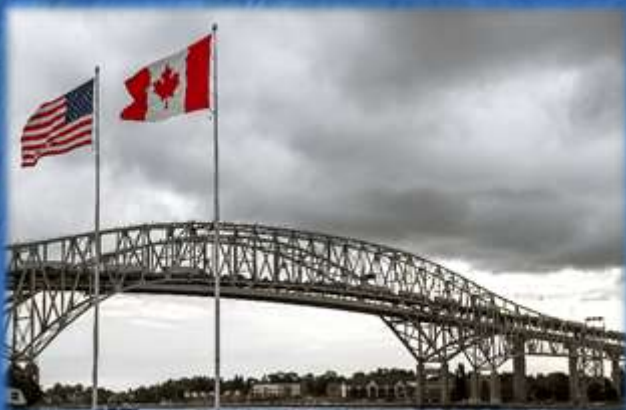
PONT BLUE WATER POINT EDWARD