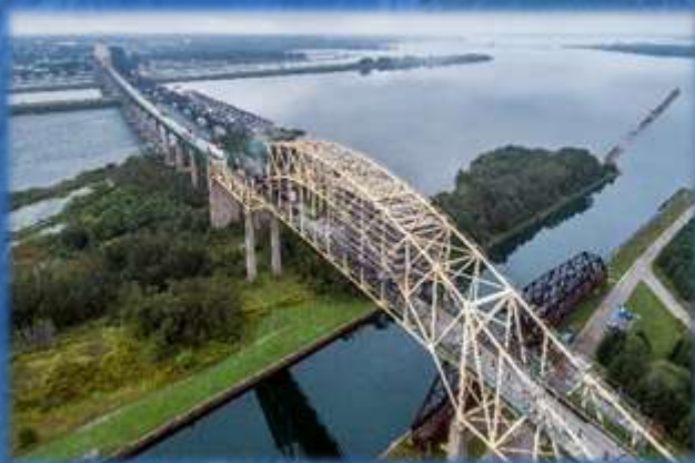
PONT INTERNATIONAL DE SAULT STE. MARIE