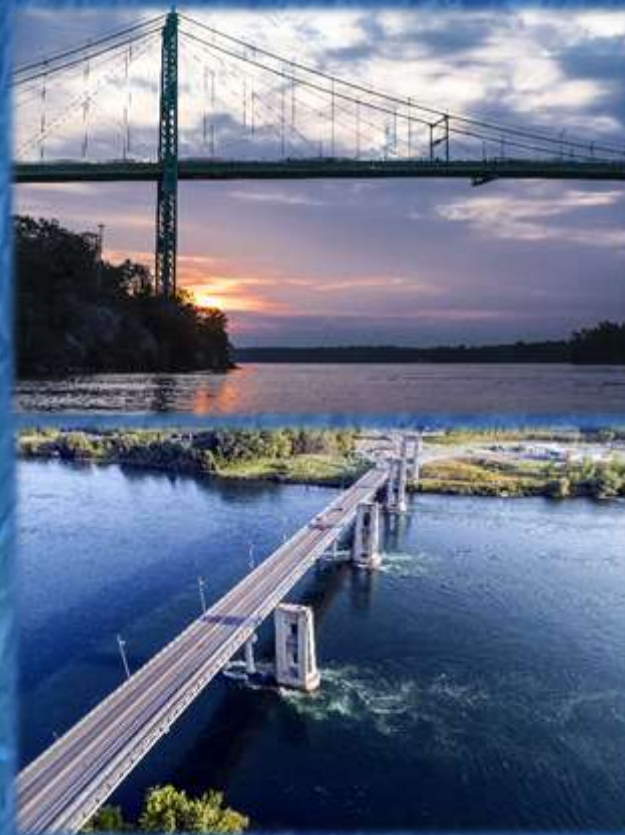
PONT INTERNATIONAL DE LA VOIE MARITIME CORNWALL